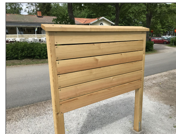
Figur 1 Bakplan på skyltstativ "Kustleden"