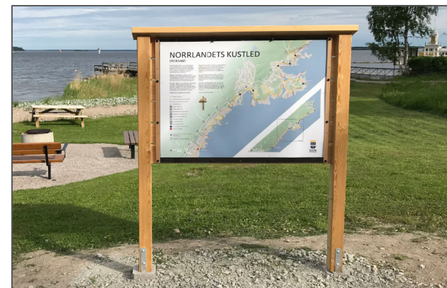
Figur 1 Front på skyltstativ "Kustleden"